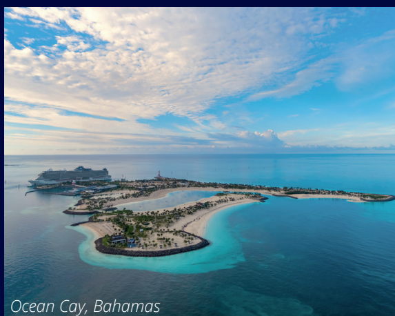
Ocean Cay, Bahamas

För mer detaljerad information om rutter, avreseperioder, hytter och priser; vänligen besök msccruises.se