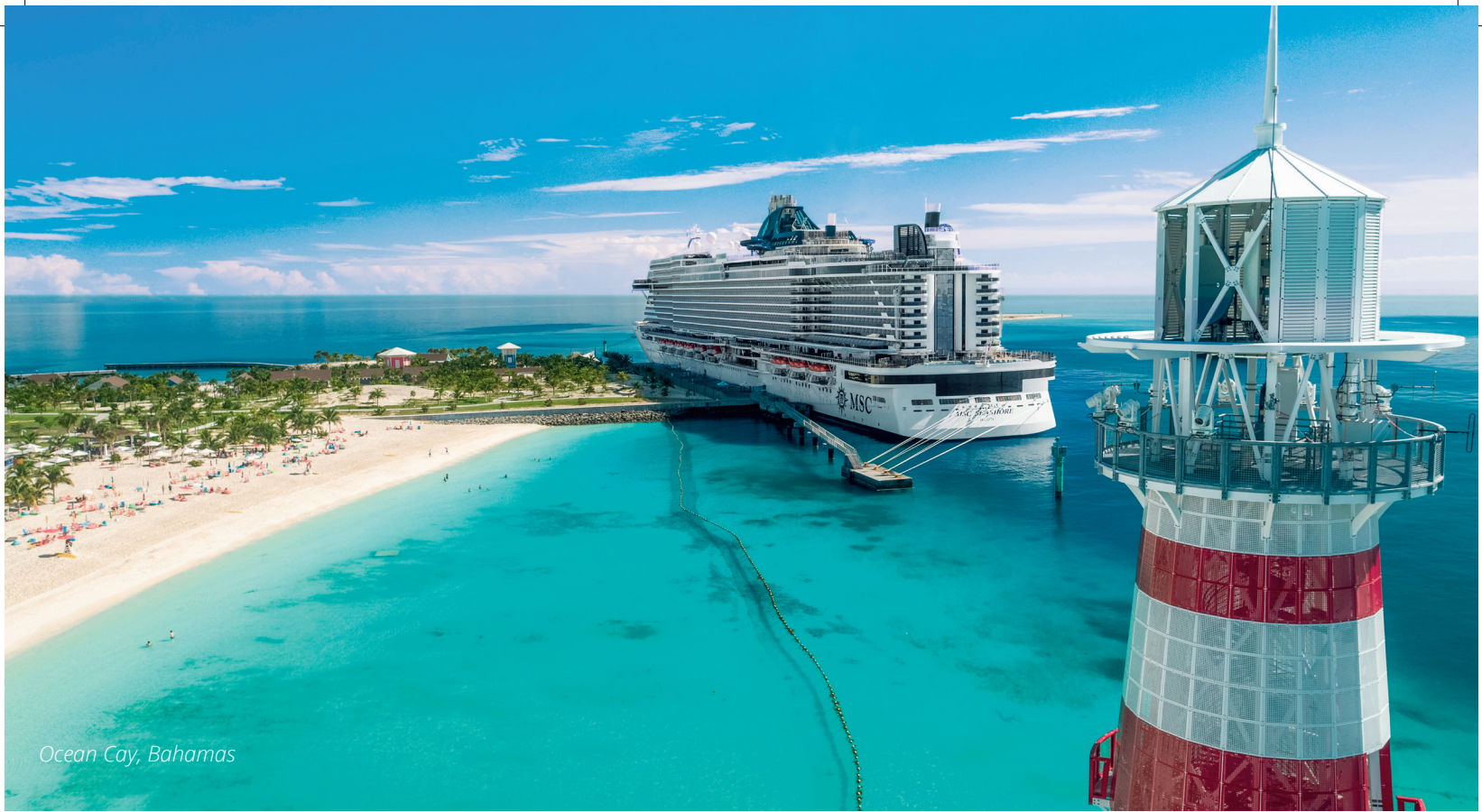
Ocean Cay, Bahamas