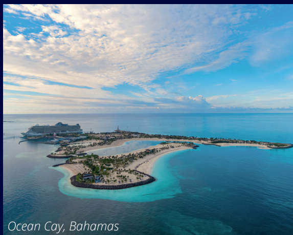
Ocean Cay, Bahamas

For mer detaljert informasjon om ruter, avreiseperioder, lugarer og priser; vennligst besøk msccruises.no